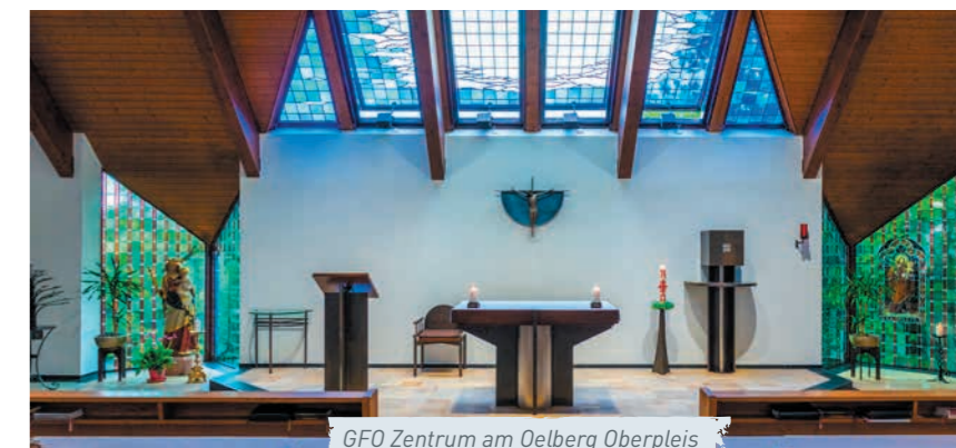
GFO Zentrum am Oelberg Oberpleis