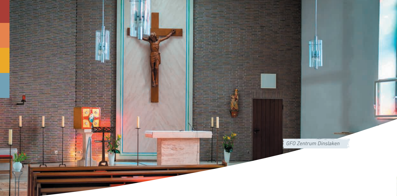
GFO Zentrum Dinslaken