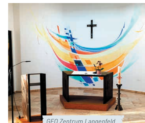
GFO Zentrum Langenfeld