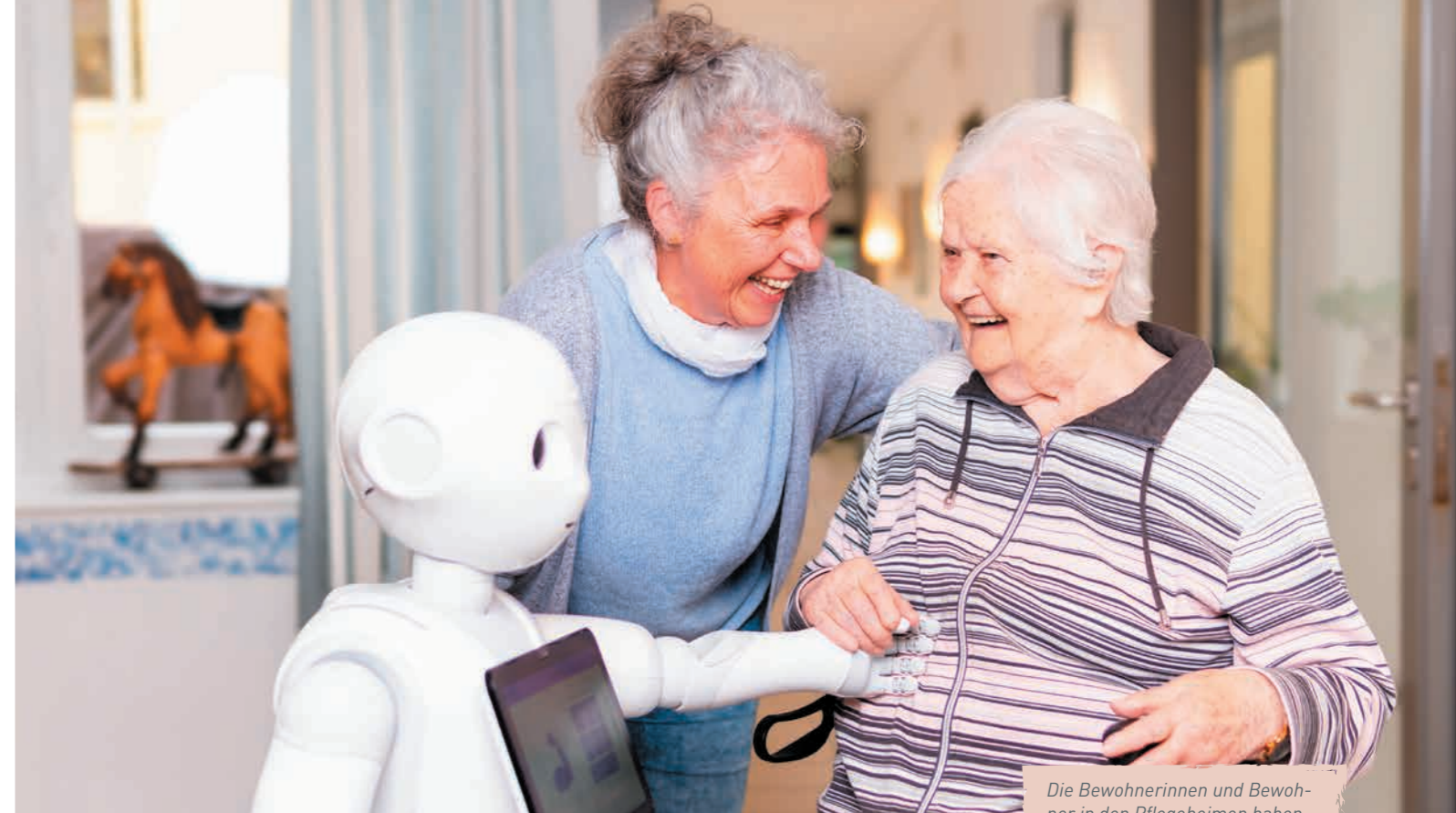
Die Bewohnerinnen und Bewohner in den Pflegeheimen haben Pepper in ihr Herz geschlossen.

der Fachhochschule Kiel, der das Projekt leitet. „Die Betreuungskraft soll den Roboter als Hilfsmittel sehen. Es geht darum, den Mitarbeitenden ein Stück weit etwas abzunehmen und es bei seinen Tätigkeiten zu unterstützen.“ Entwickelt wurde das System Pepper von der Fachhochschule Kiel und der Gesellschaft für digitalisierte und nachhaltige Zusammenarbeit Siegen. Die finanziellen Mittel für das Projekt stellt der Verband der Ersatzkassen (vdek).