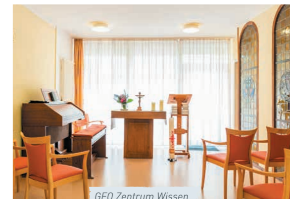
GFO Zentrum Wissen