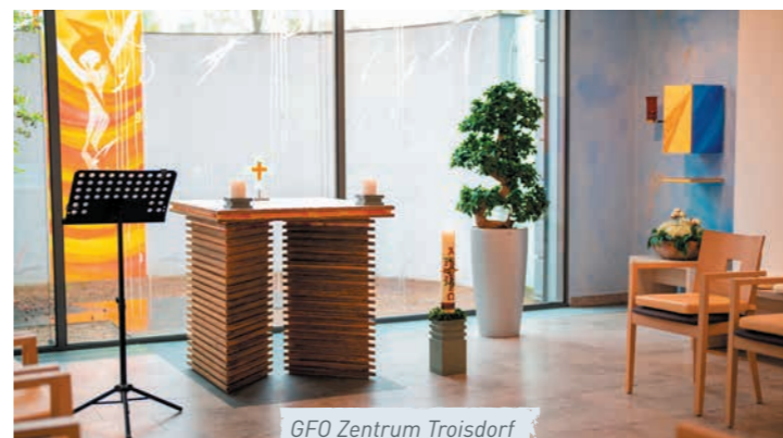
GFO Zentrum Troisdorf

Mittlerweile sind an allen Standorten entsprechende Räumlichkeiten geschaffen