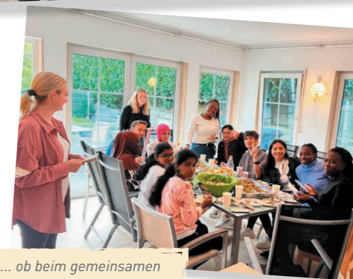
... ob beim gemeinsamen Essen, Erledigungen oder Bummel durch die Stadt.