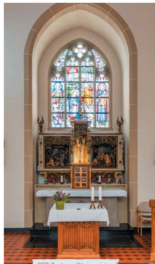
GFO Zentrum Königswinter