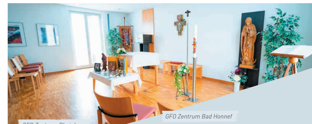
GFO Zentrum Rheinberg