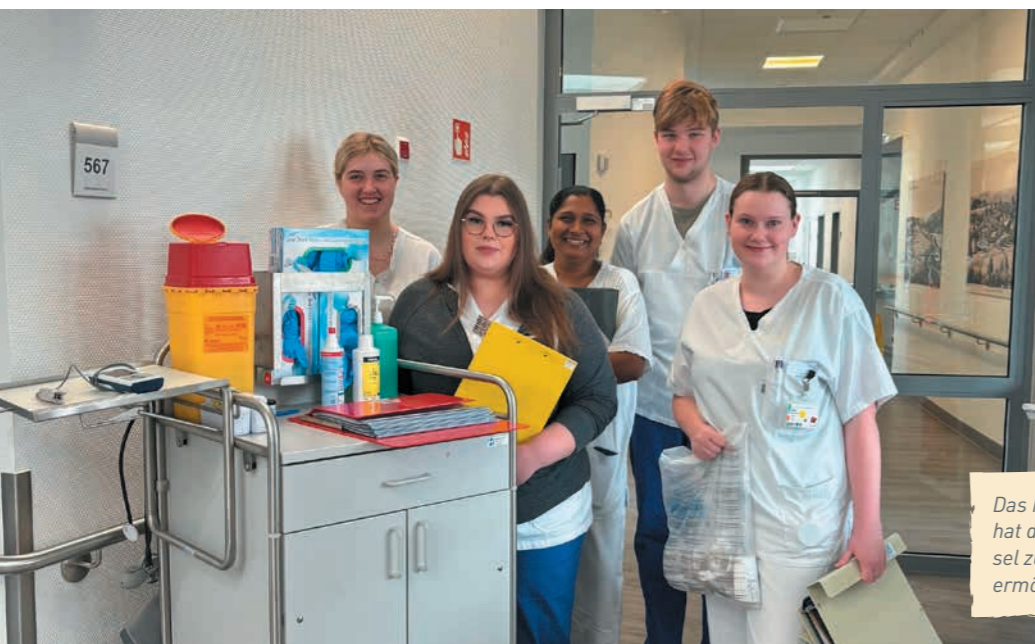
Das Projekt „Schülerstation“ hat den Azubis den Rollenwechsel zur examinierten Pflegekraft ermöglicht.